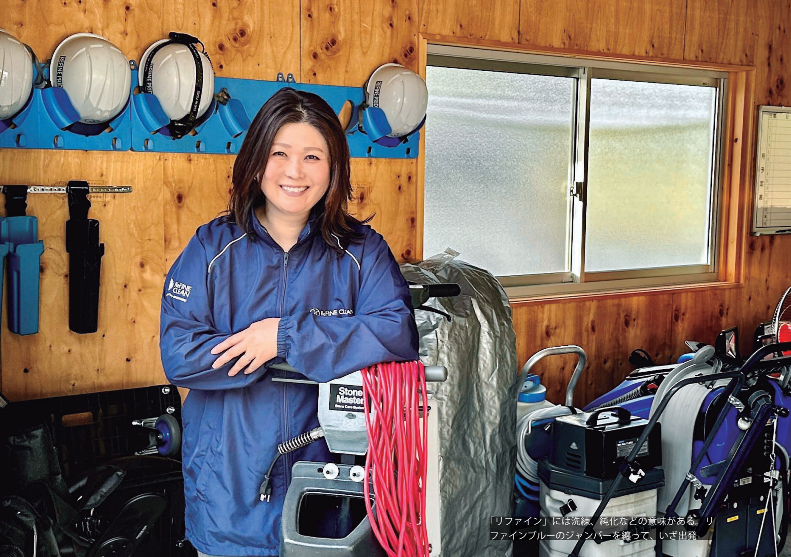
「リファイン」には洗練、純化などの意味がある。リファインブルーのジャンパーを纏って、いざ出発